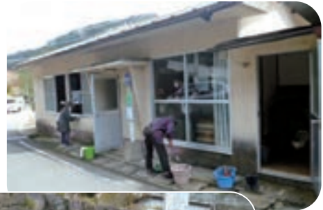
感謝の気持ちで丁寧に

ハリマJA女性会「ろうばいの会」のメンバーが、4年度の活動の締めくくりとして、活動に利用している地元の集会所やごみステーションの清掃作業をしました。この活動は毎年恒例で、グループ活動するために施設を利用させてもらっていることへの感謝を込めて、活動最終日に行っています。 隅々まできれいになった集会所で、新年度も楽しく活動してください。