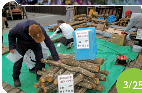
ほだ木に穴をあけ種菌していきます