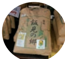
飯見地区で栽培されている「飯見の郷」

食彩館「伊和の里」では、これからも組合員の皆様が生産された農産物等の販売に協力させていただきます。