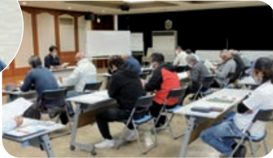
担当者による栽培方法の説明