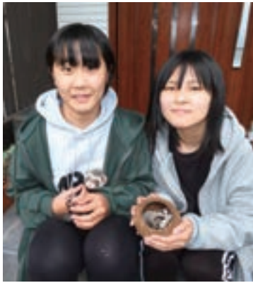
がんもを抱く凜ちゃんとかたつを抱く楓香ちゃん

なまえ 左: こたつ (フェレット オス 7歳) 右: がんも (フクロモモンガ メス 2歳)