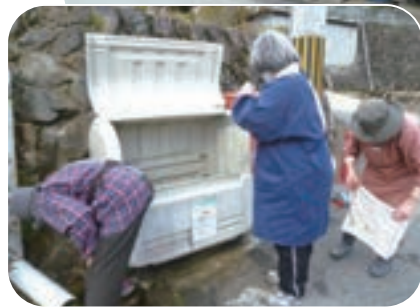
水洗いしてきれいにします