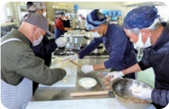
上手に包めなくても味は絶品！

今年度最終回の「エンジョイ・ライフ・クラブ」を3月14日に開催し、「中華まん」作りに20名が挑戦しました。皮にする生地の発酵は事前に事務局で行い、参加者は中に入れる具作りからスタート。玉ねぎのみじん切りに泣かされながら、ミンチ肉や調味料を加えて混ぜ込んだ具を約2倍に膨らんだ皮を麺棒で広げたものに包み込み蒸し器で蒸しました。出来上がりは持ち帰りとしていましたが、参加者は美味しそう匂いに誘われ、「二個だけでも出来立てを食べてみたい」と試食し、「買ったものよりうまいなあ、家の者にも作ってやりたい」と、出来栄えに満足しながら残りを持ち帰りました。 今回で令和4年度の予定はすべて終了しましたが、参加者からは次年度もまた新しい企画を期待しているという声や寄せられ、JAとしては男性の家事労働への進出を応援するために、今後も講座の内容をより充実していきます。