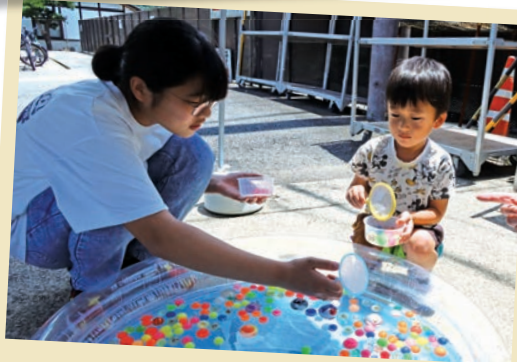
たくさんすくえたかな？

店内では特産のジャンボピーマンをはじめ、朝採れスイートコーンや新鮮で安心・安全な地場産野菜キュウリ、ナス、トマトを中心に、ブルーベリーやスイカなどの旬の果物を販売しました。播磨農高からは甘くて人気のトマト等も販売されました。また、ネオニコチノイドフリーの玄米や通年販売しているコシヒカリ玄米30kg1袋購入で5000円引き、直売所のLINE友達追加で2000円引きの特別クーポンをゲット、会員様には全品でお買上げ時のポイント2倍になるなど、来店客は多彩な催しで周年感謝祭を楽しみました。 店頭では、焼きトウモロコシや冷やし焼き芋の販売の他、スーパーボールをたくさんすくってミニトマトをゲットするゲームなど、子ども連れのお客様にも縁日気分を楽しんでいただきました。 酷暑の2日間でしたが、お目当ての農産物を買求める来客が次々と訪れ、大盛況の周年祭でした。