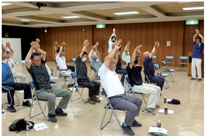
椅子に座って猫背矯正する参加者

毎年人気の、男性を対象にしたエンジョイ・ライフ・クラブも今年で7年目を迎え、今年度6回コースの第1回を7月25日に開催しました。今回は25名の参加申込者のうち17名が参加し、波賀整骨院の整体師を講師に招き歪みのない健康な体づくりの体操を行いました。日頃は農作業などで前かがみの姿勢が多いためいつの間にか猫背になってきている人が多く、椅子に座って簡単にできる体操を学びました。