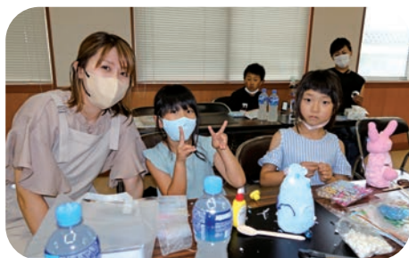
かわいい貯金箱が出来ました（ちくさ会場）