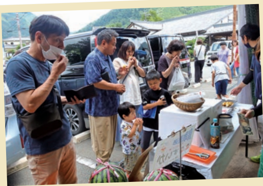
スイートコーンと冷やし焼き芋は大人気