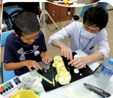
難しいところはJAのお兄ちゃん がお手伝い（一宮会場）

JAハリマは、皆様に心豊かな毎日を送っていただくため、大人から子どもまで幅広い層に対して、生活に密着した活動を実践していきます。