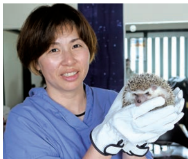
厚手の手袋を履いて抱き上げます

なまえ マロン (ヨツユビハリネズミ メス 2歳) ウニ (ヨツユビハリネズミ メス 2歳)