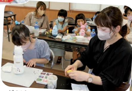
どのビーズで飾ろうかな…（ちくさ会場）