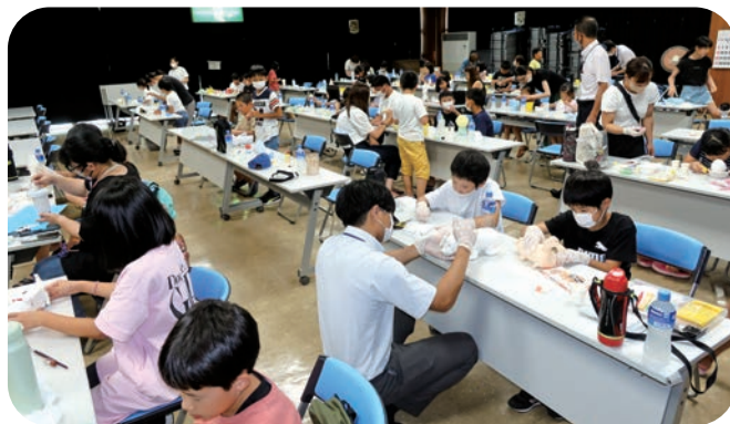
おおぜいの参加者でにぎわいました（一宮会場）

お父さんやお母さんはもちろん、おじいちゃん、おばあちゃんと参加した児童もあり、両会場とも夏休みの一日を楽しく過ごしました。