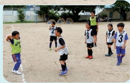
練習試合に熱が入ります