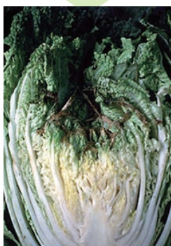
白菜のカルシウム欠乏症