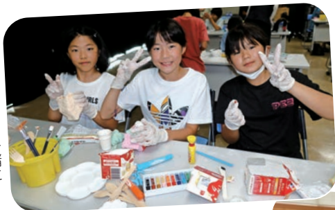
仲良しさんと一緒に （一宮会場）