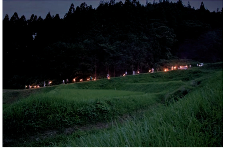
たいまつを手に飯見の棚田を練り歩く参加者

豊作を願い、たいまつを手に棚田を練り歩く「虫送り」の行事が7月23日19時から波賀町飯見で行われました。