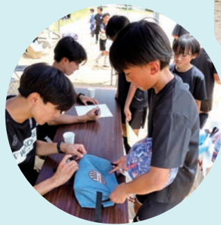
サインも楽しみです