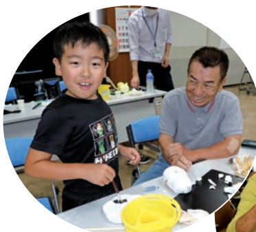
おじいちゃん・おばあちゃんと一緒に作ったよ！