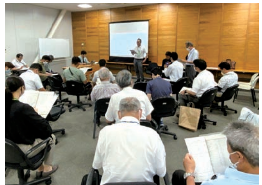
JAでの実践報告をする担当課長

西播磨地域において、農業での人手不足と就労機会を求める障害者を結ぶ農福連携への取り組みについて協議する「農福連携ネットワーク会議in西播磨」が7月14日に西播磨県民局で開催されました。この農福連携とは、作業障害のある方の農業分野での活躍機会を広げ、自信や生きがいを持って社会参画を実現することを目指し、光都農林事務所や龍野健康福祉事務所、宍粟市が中心となって推進しており、JAも全面的に協力体制を整えて受け入れを行っています。