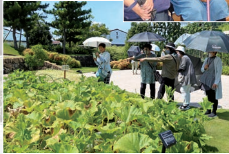
発酵肥料使用で大きく生長したカボチャ

7月28日、今年度きらきら講座の第1回は管外研修として広島県尾道市因島の万田発酵株式会社を訪れ、55人が参加しました。視察先として希望の多かった万田発酵には、令和2年度に実施計画をしていましたが、コロナ禍により中止や延期が続き4年目にしつてやっと実現しました。