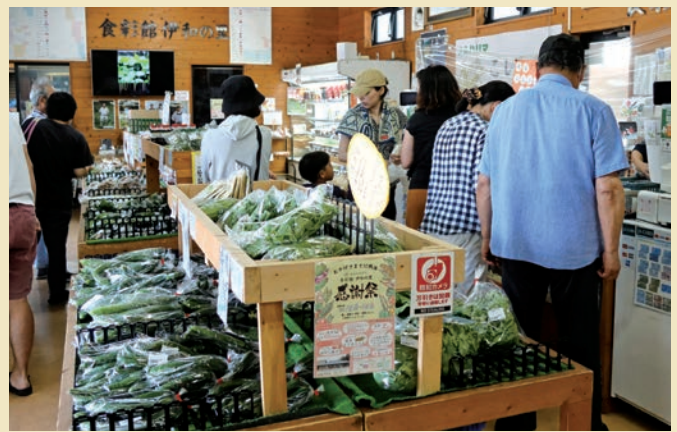
新鮮な野菜を買い求める来客

「食彩館 伊和の里」ではオープン15周年を迎え、7月22日、23日の両日、日頃のご利用に感謝を込めて恒例の周年感謝祭を開き、966人の来場者でにぎわいました。