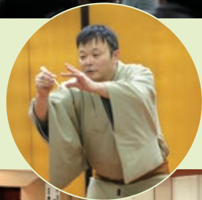
「アレの目にくくりぬいて…」 でのリアクション