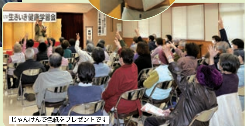
じゃんけんで色紙をプレゼントです

JAハリマは今後も地域に密着した高齢者福祉に取り組んでまいります。来年も会場で皆さんの元気な笑顔をお待ちしています。