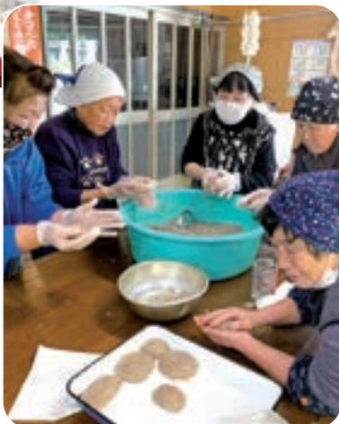
▶「手作りコンニャクはなめらかでおいしいよね」と話ながら作りました。

ハリマJA女性会福野支部では、9月30日に巻きずし作り、11月26日にはコンニャク作りをしました。巻きずし作りは初めての人や、最近作っていないから作り方を忘れた人もいて、ぜひ自分で作りたいといった声があがり、会員の中で上手な人を講師にして作りました。コンニャクは芋をいただいたことから、美味しい手作りコンニャクを作りたいねと話がまとまり、さっそく実施しました。 「どちらも以前は各家庭で作っていたけど、今ではスーパードイでも手に入るようになった。でもやっぱり手作りが一番。上手な人から作り方を伝授してもらいながら、みんなと一緒にできることが何より」と言い、これからも和気あいあいと活動していきたいと話していました。