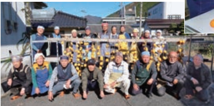
完成した吊るし柿を前に記念撮影