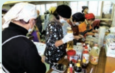
レシピを見ながら調味料を量ります

中華料理は調味料の使い方や味が大きく変わるため、参加者は慎重に計量しながら調理しました。料理講習後のミニ講座では、冬本番を迎えて風邪などひかないように免疫力アップの食材や調理方法について学びました。