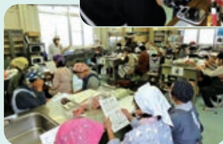
免疫力アップの勉強をしました