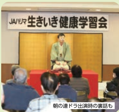
朝の連ドラ出演時の裏話も