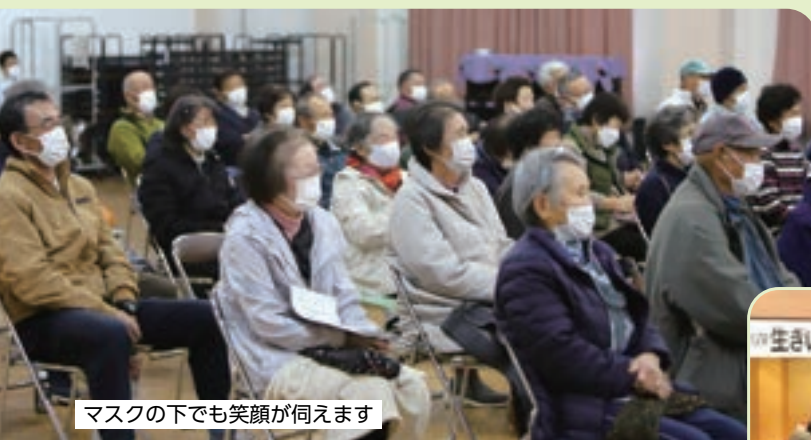
マスクの下でも笑顔が伺えます