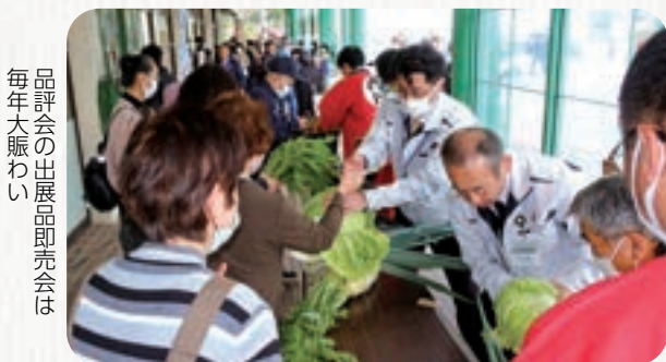
品評会の出品品即売会は 毎年大賑わい