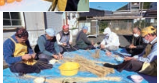
吊るす縄も自分で縄(な)います