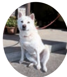
真っ白でとても美しい毛並みです