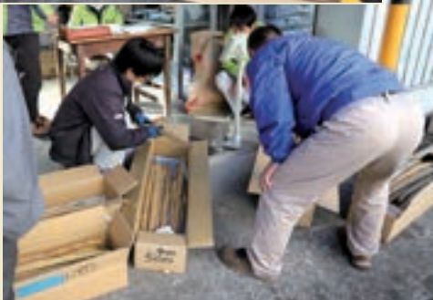
規格に合わせて選別されます