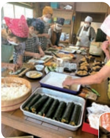
▲久しぶりの巻きずし作り、美味しく出来上がりそうです。