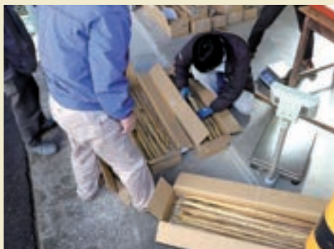
集荷場に運び込まれた自然薯

管内で栽培されている特産品の自然薯が11月下旬、出荷の最盛期を迎えました。今年は異常な高温が続き、夜間も温度が下がらなかつたことが自然薯の成長の妨げとなり、例年に比べて細く短いといったものが多くなりました。しかし、生産者の皆さんの努力により何とか収穫期を迎えることができました。 収穫された自然薯は波賀営業部の集荷場に集められ、大きさや形状、重さ、色、傷の状態などの規格に合わせて5種類に選別。今年の収穫は12月中旬まで予定されています。 強い粘りと独特の香りが特徴の自然薯。贈答や家庭用にぜひご利用ください。