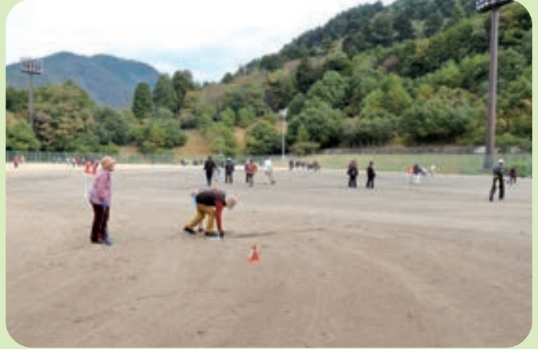
広いグラウンドで熱戦を繰り広げる参加者

宍粟市グラウンド・ゴルフ協会は毎年恒例の秋季交歓大会を、11月15日に一宮町東市場のスポニックパーク一宮で開催されました。