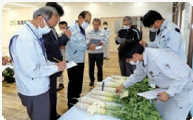
農産物品評会 審査風景