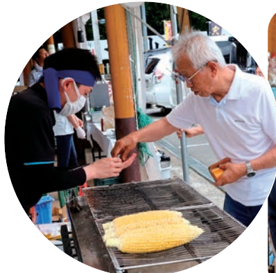
焼きトウモロコシは大人も子供も大好きです