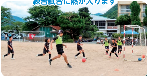
練習試合に熱が入ります

Jリーグ、ヴィッセル神戸のスクールコーチを招いたサッカー教室が7月13日、はりま一宮小学校グラウンドを会場に開かれ、管内のサッカークラブの小学生40人が参加しました。 開会式後は、低・中・高学年の3グループに分かれ練習を開始。4名のプロのコーチから指導を受けられるとあって、教室に参加した子どもたちは熱心に練習に取り組み、攻撃や守備の動作、ボールを持った時のポジション