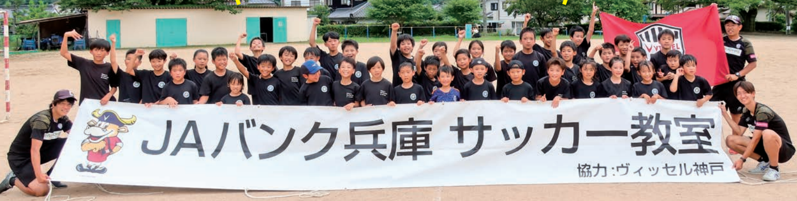
まずは基本をしっかりと