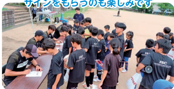
サインをもらうのも楽しみです

ンの取り方など、基本動作を学びました。基礎練習後は実戦形式のミニ試合を行い、ゴールを狙って必死にボールを追いかけてました。 梅雨の晴れ間とまではいかず曇り空で大変蒸し暑い中、熱中症対策に十分な水分補給と休憩を入れながら、子どもたちは元気いっばいにグラウンドを駆け回りました。 JAハリマは今後も地域貢献の一環として、子どもたちを対象としたさまざまな体験の場を提供していきます。