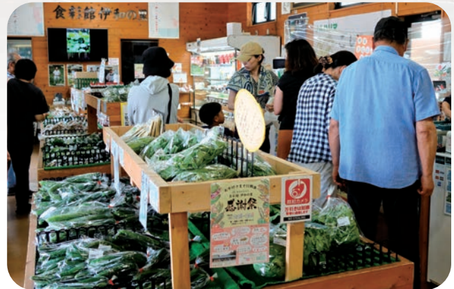
新鮮な野菜を買求める来客

酷暑の2日間でしたが、お目当ての農産物を買求める来客が次々と訪れ、大盛況の周年祭でした。