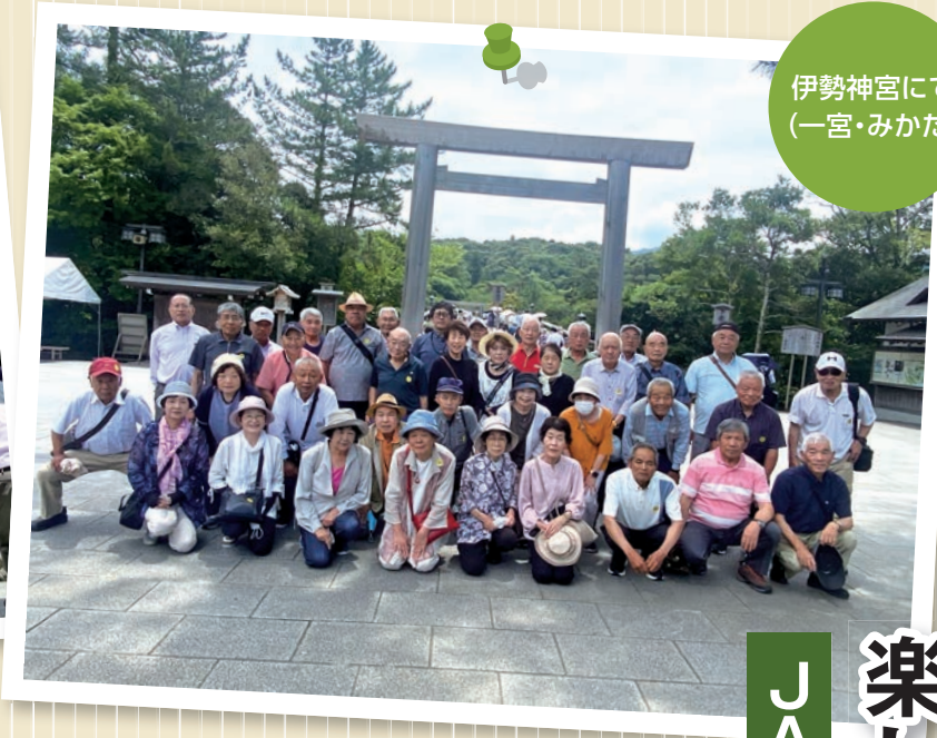
伊勢神宮にて (一宮・みかた)