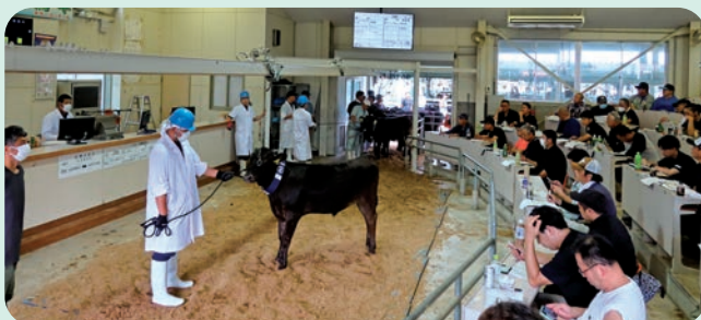
競り落とされる子牛

夏場は牛の暑さ対策をしっかりと行いましょう。扇風機や窓の開閉による換気を行いながら牛舎内の温度を下げたり、新鮮な水を常時飲めるようにして、牛にとって快適な環境を維持していきましょう。