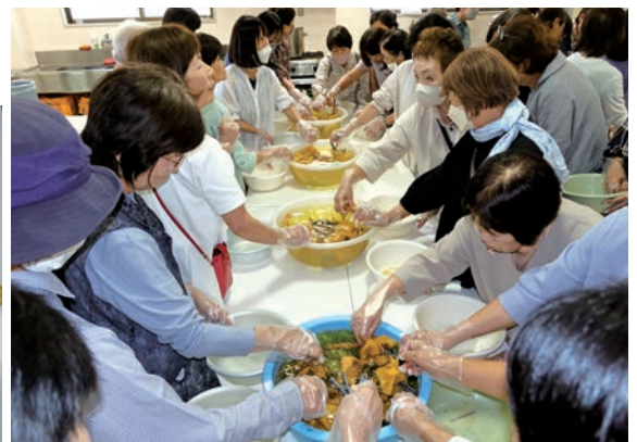
タマネギの皮の煎じ汁できれいな発色