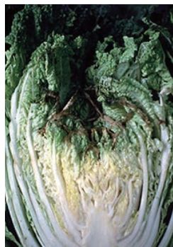
白菜のカルシウム欠乏症