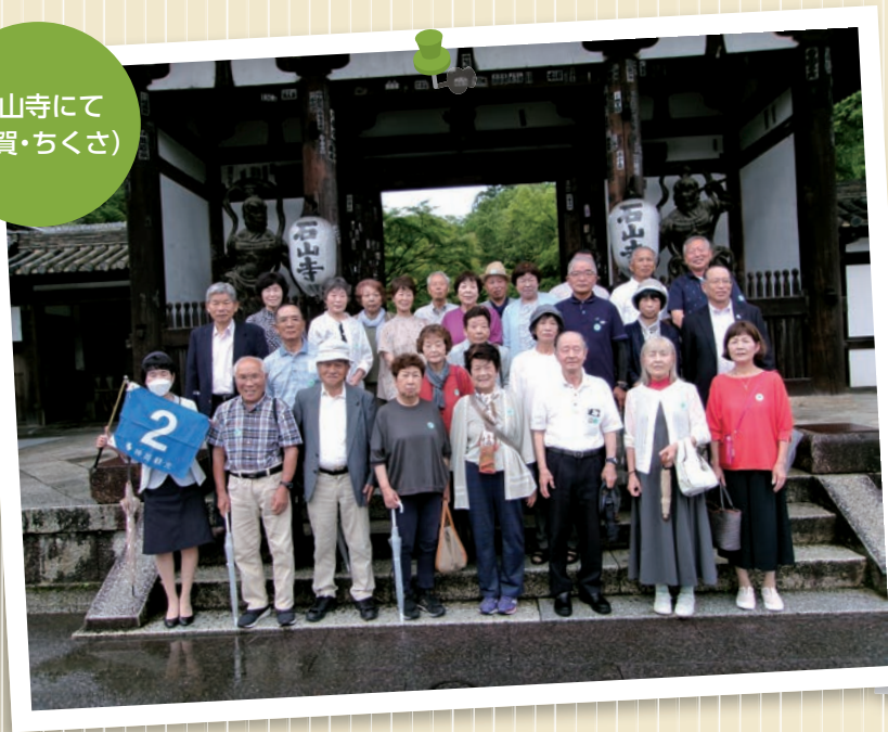
石山寺にて (波賀・ちくさ)