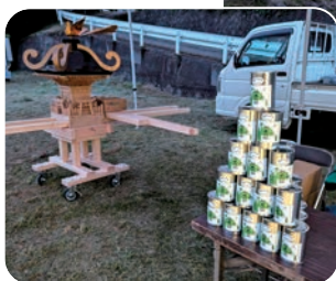
新しい御神輿と空気の缶詰