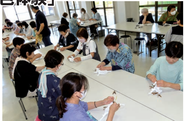
頭に柄を描きながら縛ります

7月5日、今年度きらきら講座の第2回目は管外研修として淡路でタマネギの皮を使った「染色体験」を開催し、54人が参加しました。 晴天に恵まれたこの日、うずまちテラスで遠目にうず潮を見学した後、ウエルネスパーク五色でタマネギの茶色の皮を染料にしてハンカチに染色する体験をしました。きれいな絞り模様を出すためにそれぞれ工夫をこらしてハンカチをゴムで縛り、タマネギの皮の煮汁で染めたあと、3種類の色の違う媒染液に順次