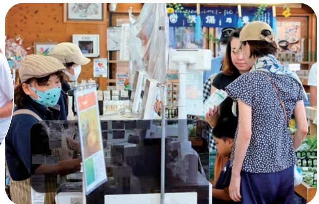
レジではお客様がとぎれません

夏場は牛の暑さ対策をしっかりと行いましょう。扇風機や窓の開閉による換気を行いながら牛舎内の温度を下げたり、新鮮な水を常時飲めるようにして、牛にとって快適な環境を維持していきましょう。