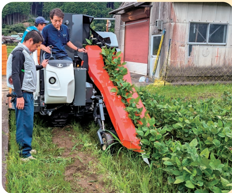
圃場にて大豆が次々と刈り取られていきます (収穫作業の大幅な時間短縮につながります)

※宍粟北農業振興協議会は、エダマメを収穫するための労働力を省力化するために、このたび「エダマメ用コンバイン」を導入しました。