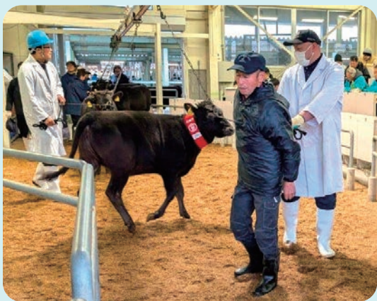
競り落とされた子牛は生産者と退場します

これからは、厳寒期に入り寒さから抵抗力が落ちて病気にかりやすくなるので、十分な換気を心がけて体調管理に気をつけましょう。