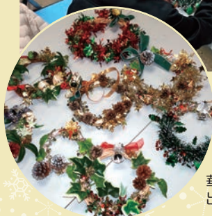
華やかなリースの 出来上がり！