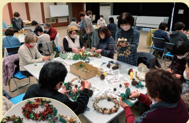
楽しくデコレーションしました

クリスマスには、ツリーと一緒にかわいいリースで“メリー・クリスマス”だったことでしょう。