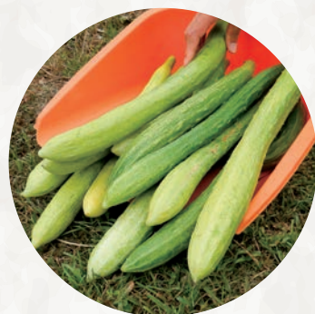
90センチ(三尺)ほどに育ちます