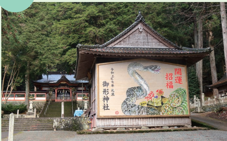
力強い巳を描いた巨大絵馬