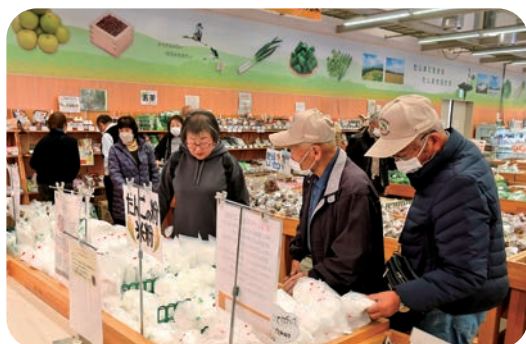
店内をじっくり見学

農産物直売所生産部会は、12月2日にJAたじまの「ファーマーズマーケットたじま」にて視察研修会を実施しました。今回は41名が参加し、まずJAたじま営農担当職員より「コウトリ育む農法」から学ぶ環境創造型農業について講義を受けました。 減農薬・農薬不使用で栽培するためには、水田の生物を増やし土壌改善が必要であるといったことを学びました。参加者は熱心に話を聞き、時間の許す限りさまざまな質問をしましたが丁寧な説明に、直売所同士