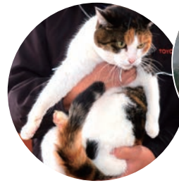
元気一杯の「めちゃ」