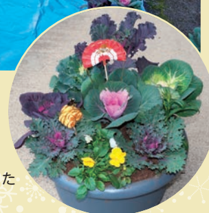
お正月の玄関を飾った 寄せ植え