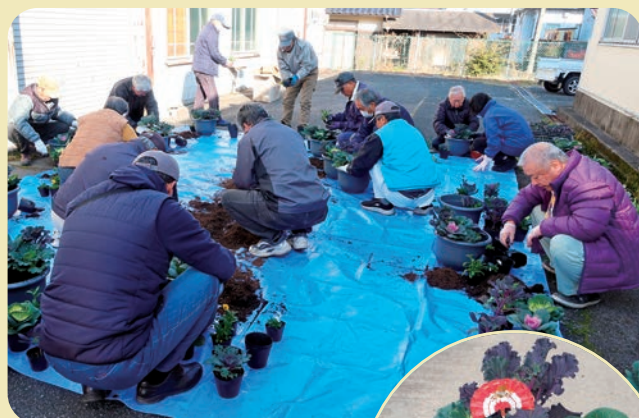
思い通りに植えていきました

扇や凧などの正月飾りピックを差し込んだ完成品は、玄関先で新年のお客様をお迎えしました。