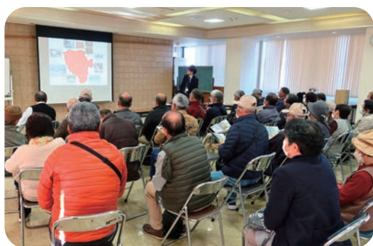
説明に聞き入る参加者

農産物直売所生産部会は、12月2日にJAたじまの「ファーマーズマーケットたじま」にて視察研修会を実施しました。今回は41名が参加し、まずJAたじま営農担当職員より「コウトリ育む農法」から学ぶ環境創造型農業について講義を受けました。 減農薬・農薬不使用で栽培するためには、水田の生物を増やし土壌改善が必要であるといったことを学びました。参加者は熱心に話を聞き、時間の許す限りさまざまな質問をしましたが丁寧な説明に、直売所同士