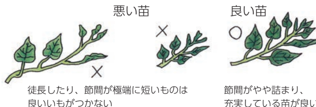
悪い苗 徒長したり、節間が極端に短いものは 良いもが見つからない