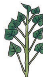
〈直立ざし〉 いもの数…最も少ない 肥 大…最も早い