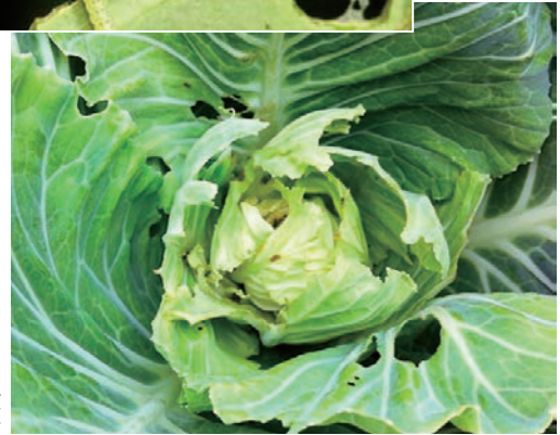
ヨトウムシによる食害