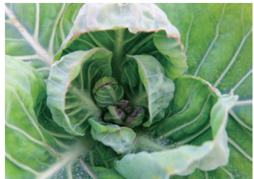
カルシウム欠乏症の症状

一般的にカルシウム欠乏症の場合、葉の先端部ではなく両脇から症状が出ることが多い。その後、枯死斑の現れる部分が拡大し、上位葉の生育も抑制される。土壌中で絶対量が不足して発生することは少ないが、土壌中のチッソやリンの過剰により吸収バランスを崩して発生することがある。この場合、土壌中にカルシウムがたくさんあっても発生する。体内の再移動は少ないため、常に供給されている必要がある。また、土壌が乾燥したときに発生が助長される。